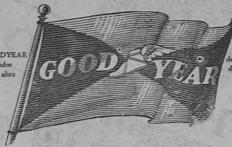
La marca GOODYEAR en los costados identifica la obra

Por eso es que desde hace 20 años consecutivos "en el mundo entero inas personas viajan sobre llantas Goodyear que sobre las de cualquier otra marca". Si Ud. quiere sacarle todo lo posible a su dinero no se deje engañar con imitaciones comprando llantas que no llevan la marca "Goodyear" en sus costados.